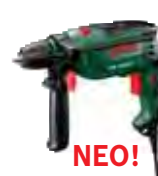
PSB 50 RE